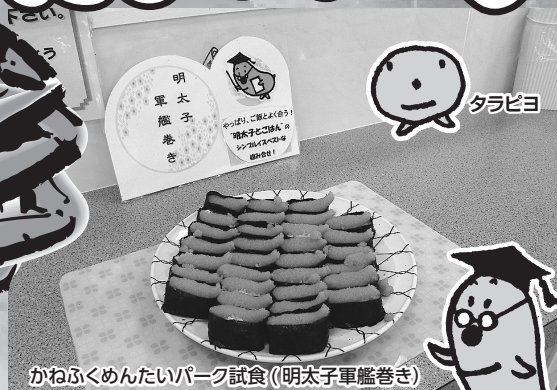
かねふくめんたいパーク試食 (明太子軍艦巻き)