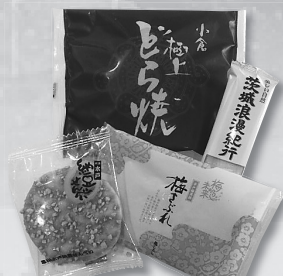
水戸銘菓のちょっぴりプレゼント (亀印本舗)