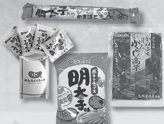
めんたいパークちょっぴりプレゼント 4品の内いづれか1品となります (選択はできません)