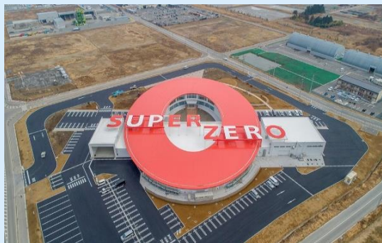
浅野燃糸大規模生産工場：SUPER ZERO